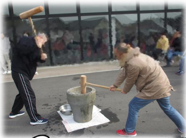
12月28日餅つき大会を開催しました。晴天の下、皆さんの掛け声がよく響き、その力強い餅つきの結果、とてもおいしくできました。