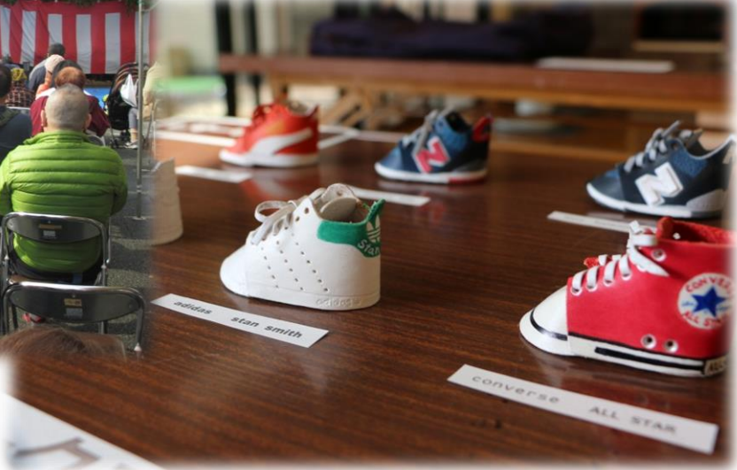
デイケアの活動で作った革細工キーホルダーです。 どの作品も丁寧な作りで、よくできていますね！