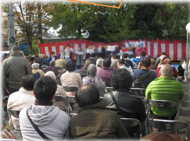
デイケア合唱部「すずらん」による合唱の様です。 練習の成果がよく表れた合唱でした。