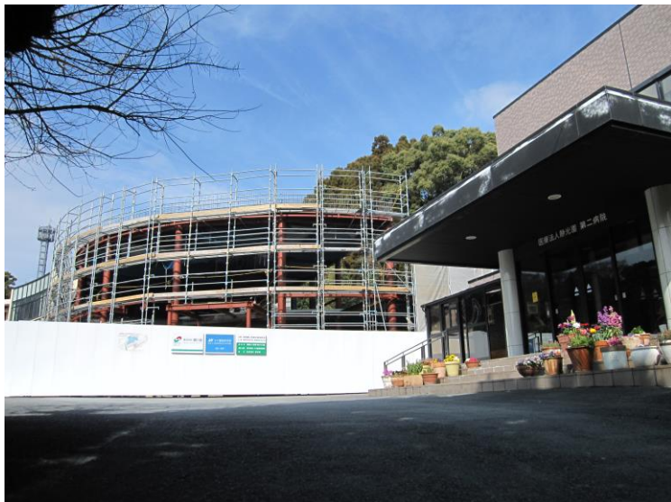
▲ 当院入口と施工中の新外来棟（本年7月完成予定）